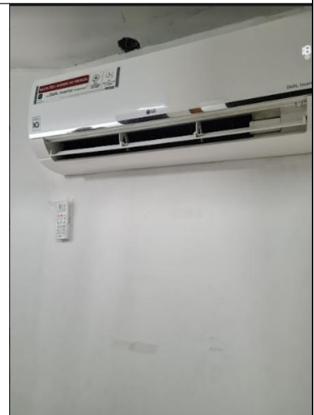
Foto 3: Aire acondicionado para mantener la temperatura del depósito

Se evidencia que el depósito cuenta con un aire acondicionado (Foto 3) para garantizar las condiciones de temperatura del lugar, se observa una ventana la cual está cubierta con material oscuro para evitar la incidencia de la luz directa sobre el material audiovisual y contenedores (radiación visible lumínica, menor o igual a 100 lux), sin embargo, no se logra evidenciar deshumidificador, detector de humo, ni extintores dentro del depósito.