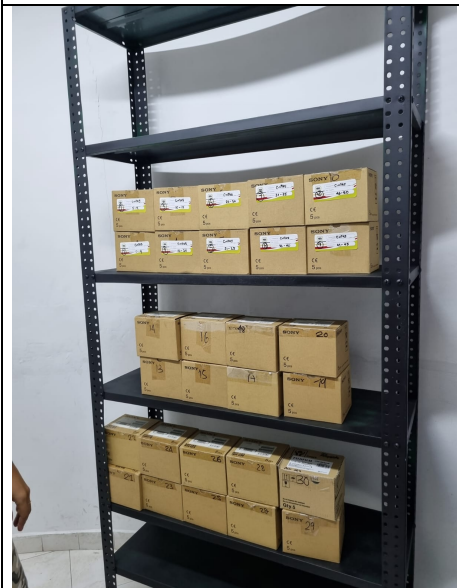
Foto 1: Estanteria con material audiovisual (cintas LTO) en cajas

El control de acceso al depósito es mediante puerta con llave a la cual accede la líder del proceso y el personal de apoyo, se encuentra que material audiovisual (cintas LTO) están dentro de cajas dispuestas en un (1) estante, como se muestra en la foto 1, luego de la inspección la encargada del proceso organizó el material como se muestra en la foto 2. Se evidencia que la estantería utilizada cuenta con pintura electrostática, se ajusta a lo establecido en la normatividad en cuanto a sus características y al procedimiento de conservación (M-GA-P01)