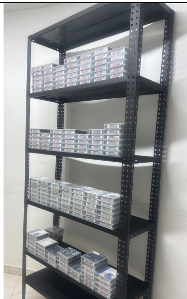
Foto 2: Estanteria con material audiovisual (cintas LTO) en organizadas